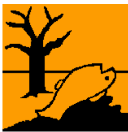
Nebezpečný pro životní prostředí